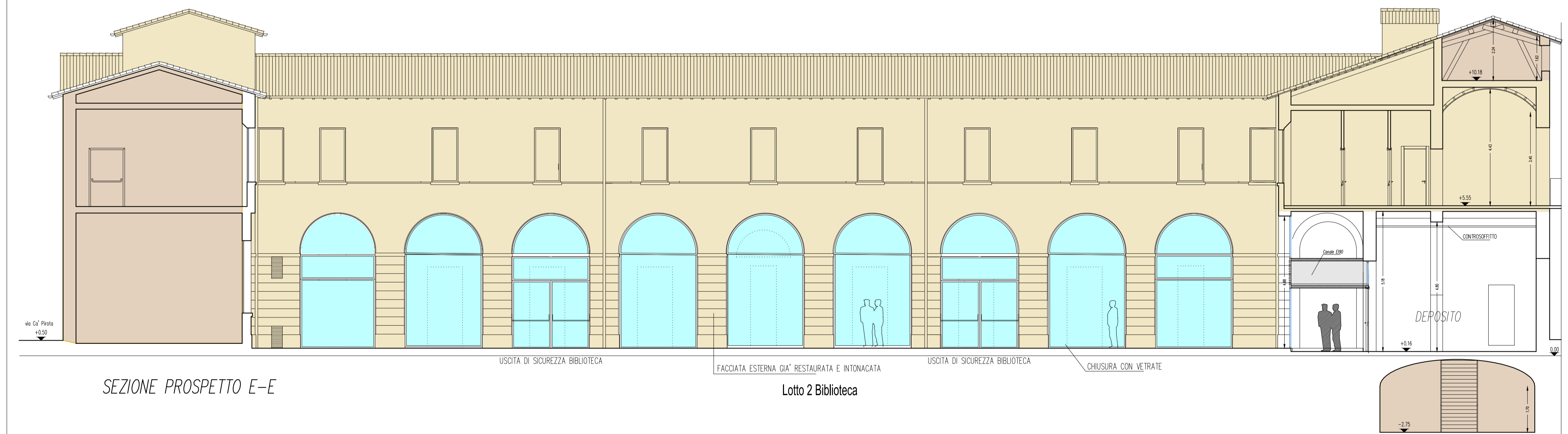
SEZIONE PROSPETTO E-E